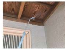
害虫ブロック技能者が施工します。